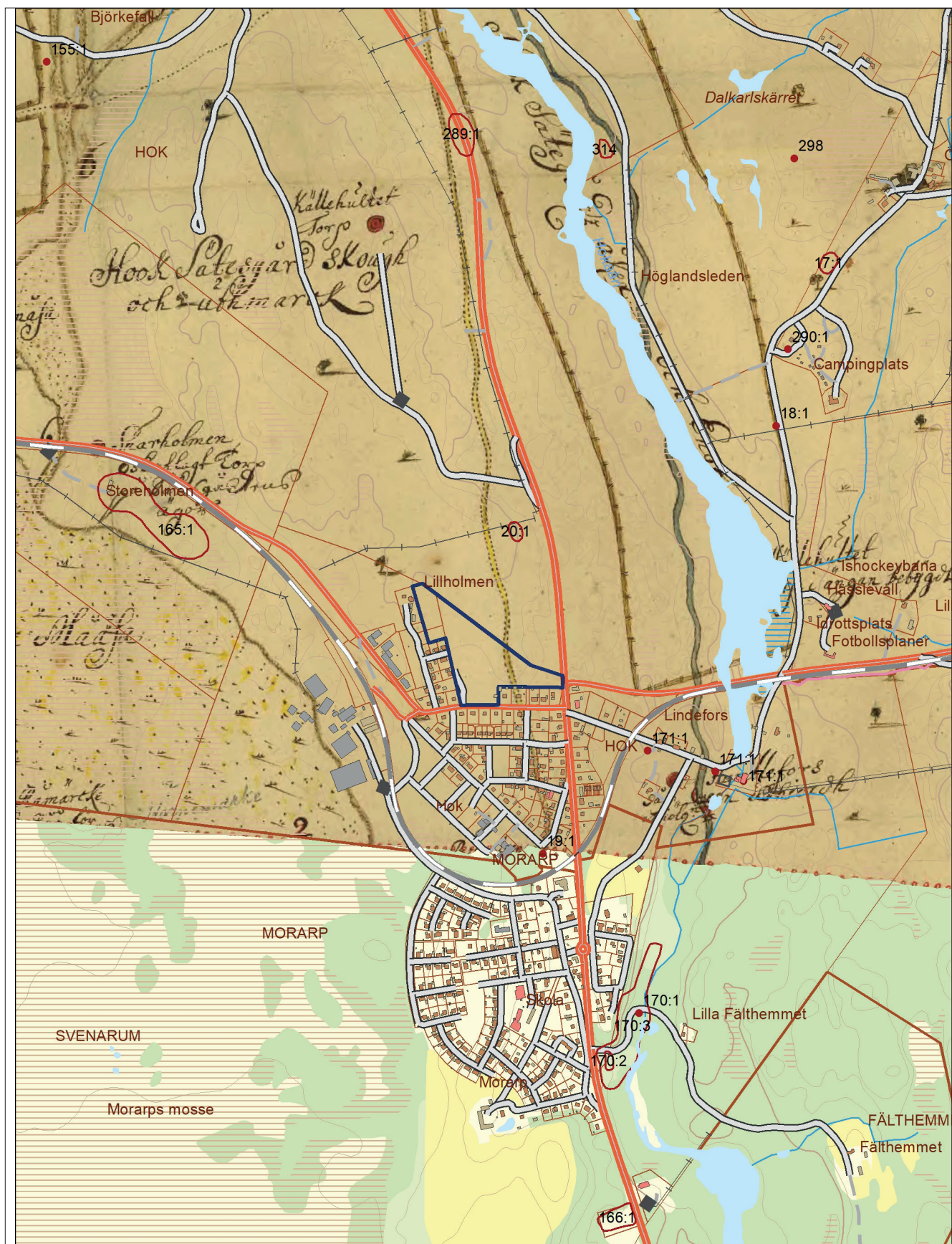
Figur 2. Den geometriska avmätningen från 1686 lagd på dagens ekonomiska karta. Utredningsområdet är blåmarkerat.